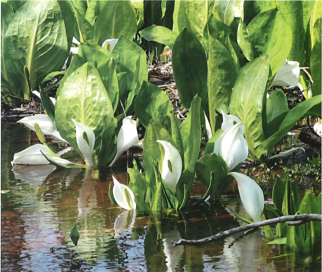
飯豊町添川地内 水芭蕉群生地

発行所 山形県長井市今泉552番地 白川土地改良区 電話 (0238) 88-9331(代) FAX (0238) 88-9348 印刷 (株)サンノー企画印刷