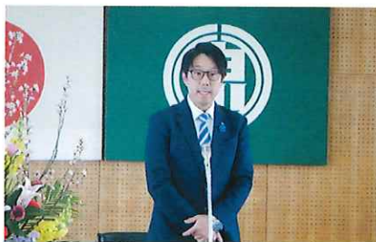
川西町長 茂木晶様