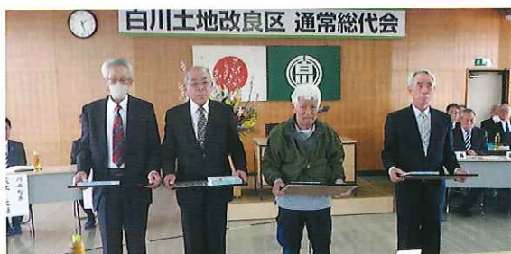
表彰を受けられた総代の方々