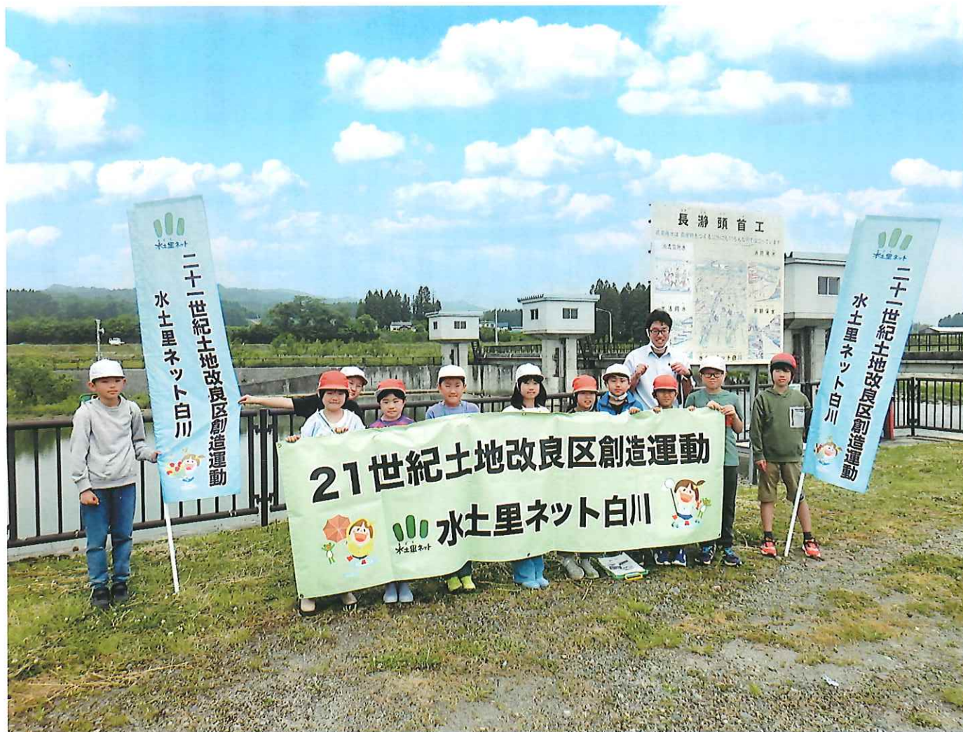
大塚小学校「白川 水の道」探検隊